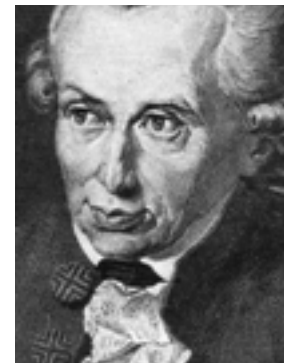
Immanuel Kant criticus in de tijd van de Verlichting

Wanneer we aankomen in de romantiek – de tijd waarin emotie, verbeelding en intuïtie ‘key’ waren – neemt de subjectieve ervaring de overhand. De criticus komt daarmee in een benarde positie. Vanaf dit punt vervagen alle grenzen en daarmee alle objectieve maatstaven, er zijn geen regels meer waaraan een kunstwerk zou moeten voldoen. Het wordt de taak van de critici om, in de kritiek, het kunstwerk een nieuwe betekenis te geven door hun eigen interpretatie te geven. (Dekker, 2010). Niet alleen kunstenaars bewegen zich in een vrije markt, ook de kunstcriticus moet zijn mannetje staan – zonder enig format of houvast.