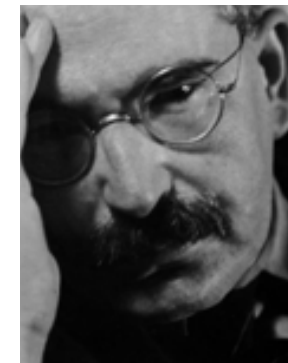
Walter Benjamin criticus in de tijd van de Romantiek