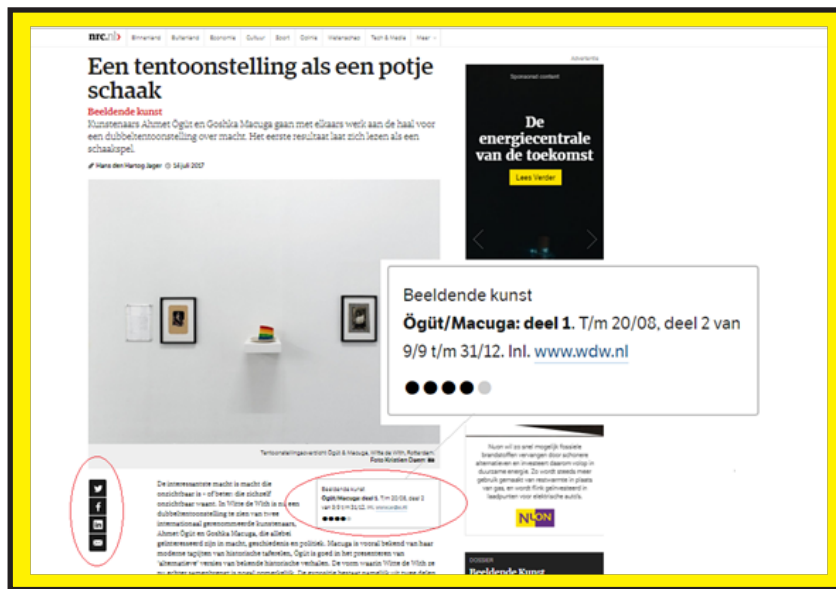
Een artikel van nrc.nl door Hans den Hertog Jager – 500 woorden + rating a.d.h.v. bolletjes

De nieuwe kunstcriticus zal een positie moeten veroveren in de enorme verscheidenheid die de digitalisering met zich meebrengt. Ondertussen probeert ook de lezer zich een weg te banen tussen het massale aanbod van culturele platforms tot amateur bloggers en vloggers. Voor dit onderzoek wil ik de laatste groep even buiten beschouwing laten, omdat deze minder relevant is voor de onderzoeksvraag. Het gaat dus om een vorm voor de professionele platforms en critici, die het publiceren en schrijven over kunst en cultuur uitoefenen als beroep.