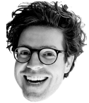
Ko van 't Hek criticus of journalist? anno 2017

De laatste jaren klinken de alarmbellen: de kunstkritiek zou te weinig ingaan op een kunstkritische beschouwing en teveel neigen naar een consumentengids (van Hamersveld, 2015). Inmiddels lijkt er vaak meer sprake van kunstjournalistiek of een recensie dan van kunstkritiek. Voorheen was de criticus een beoordelaar die op systematische wijze een gedetailleerde analyse gaf van iets. Deze beoordeling ging dan vaak gepaard met het becommentariëren van de maatschappij – maar wie zit daar nog op te wachten? (Polak, 2016)